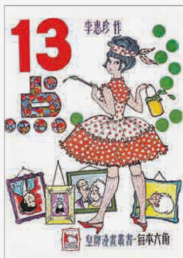
◀漫畫《13点》由李惠珍於1960年代開始創作，深受女生歡迎