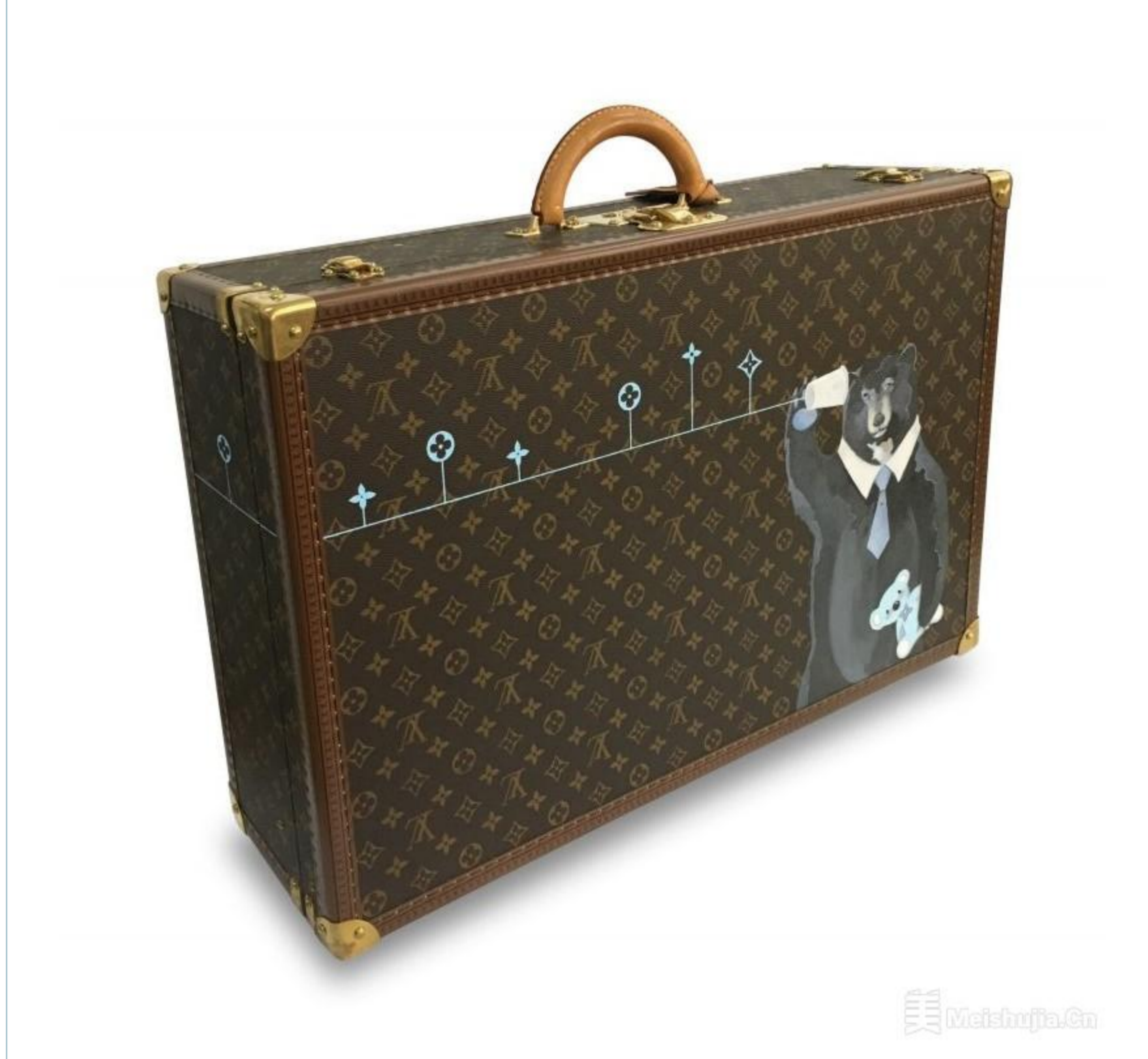
(7/7) 《LV Trunk - Ear Consciousness》，香建峰，2018年

展览名称: 收藏家之选艺术展 展览时间: 2023/03/23~2023/04/10 展览地点: [香港]-香港湾仔港湾道2号香港艺术中心5楼-(包氏画廊) 主办单位: 包氏画廊 参展艺术家: 群展 时间: 10:00 - 20:00 为迎接香港艺术中心第一届「Collectible Art Fair」，本次展览将呈现超过30件当代艺术作品，涵盖绘画、油画、雕塑、陶瓷、装置和摄影等多元媒介。这些作品来自9位香港收藏家的珍藏，创作者均为香港艺术学院的校友，展览旨在以此推动本地艺术的发展。 版权与免责声明： 【声明】本文转载自其它网络媒体，版权归原网站及作者所有；本站发表之图文，均出于非商业性的文化交流和大众鉴赏目的，并不代表赞同其观点和对其真实性负责。如果发现涉嫌抄袭或不良信息内容，请您告知（电话：17712620144，QQ：476944718，邮件：476944718@qq.com），我们会在第一时间删除。