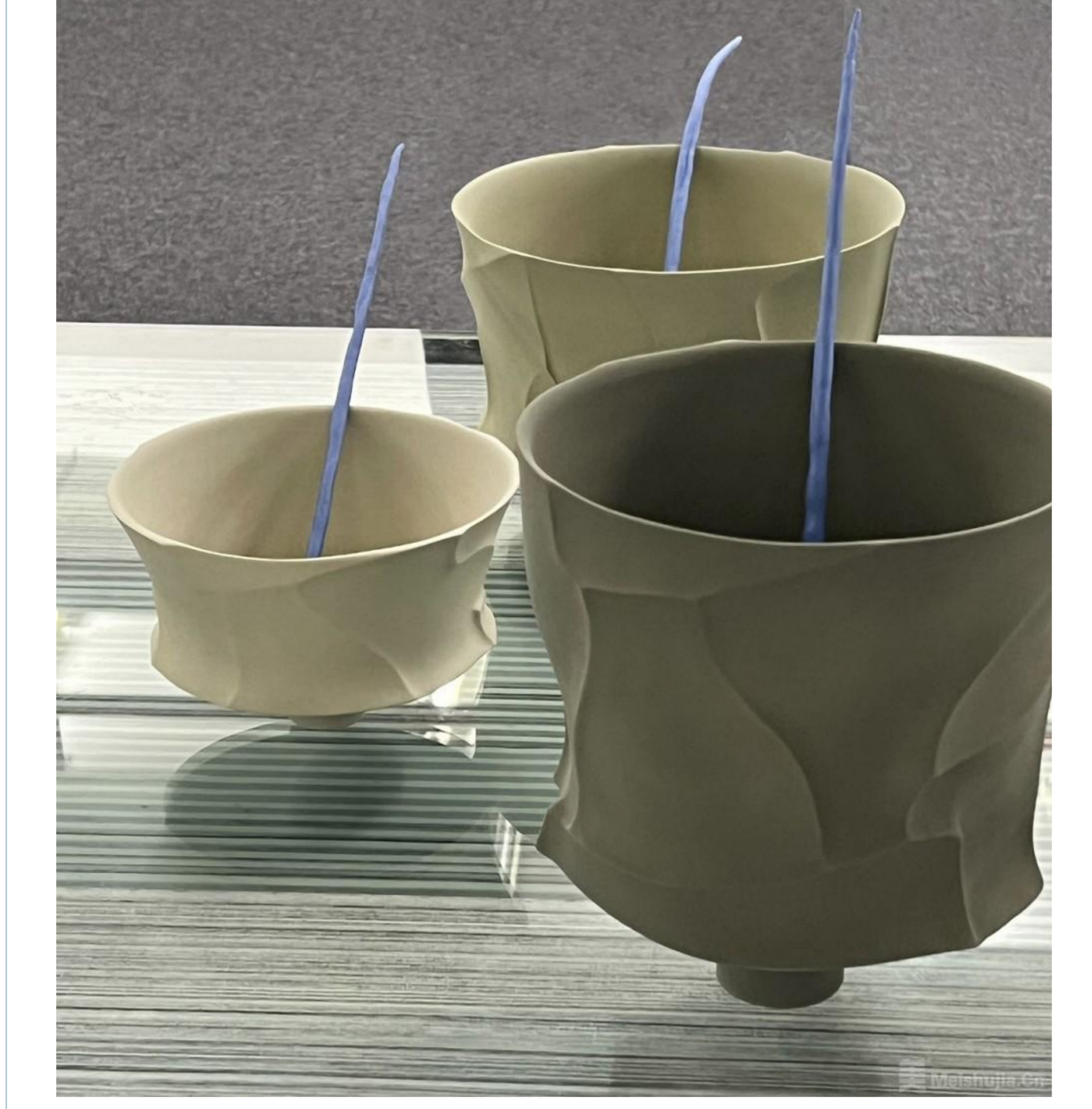
(6/7) 《In Between》，赵汝诚，2021年