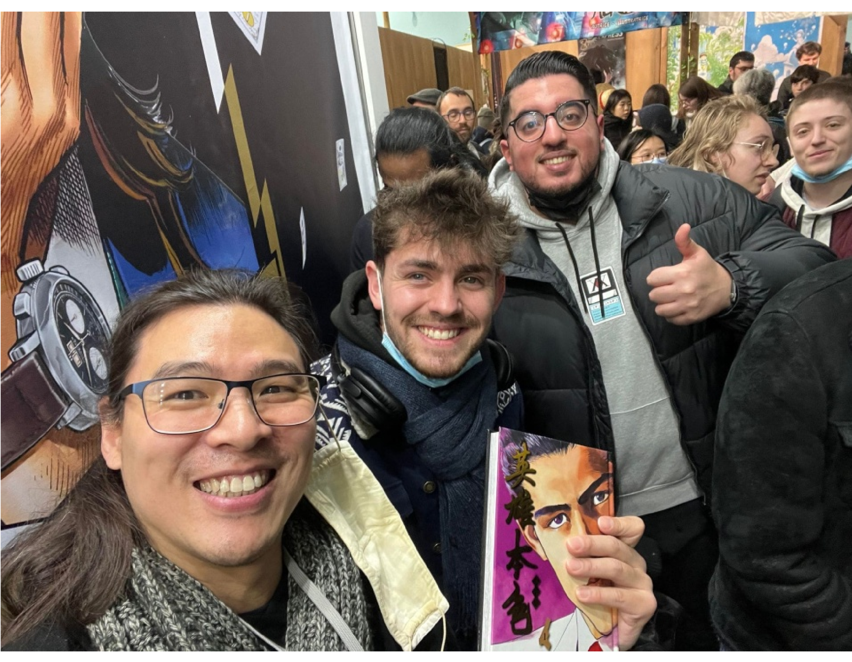
筆者與法國漫畫迷一起等候索取池上遼一老師簽名。

漫畫節主辦方為隆重其事，請來日本昭和、平成、令和時代的幾位代表漫畫家擔任嘉賓，並舉辦原畫展和大師班。他們分別是劇畫殿堂級漫畫家池上遼一老師、恐怖大師伊藤潤二老師、《進擊的巨人》作者諷山創老師，此外，又向幾位漫畫家頒獎致敬。筆者參與了其中一場大師班，發現屬前輩級的池上也一老師依然吸引不少年輕讀者，他們對於老師的分享表現得非常雀躍。