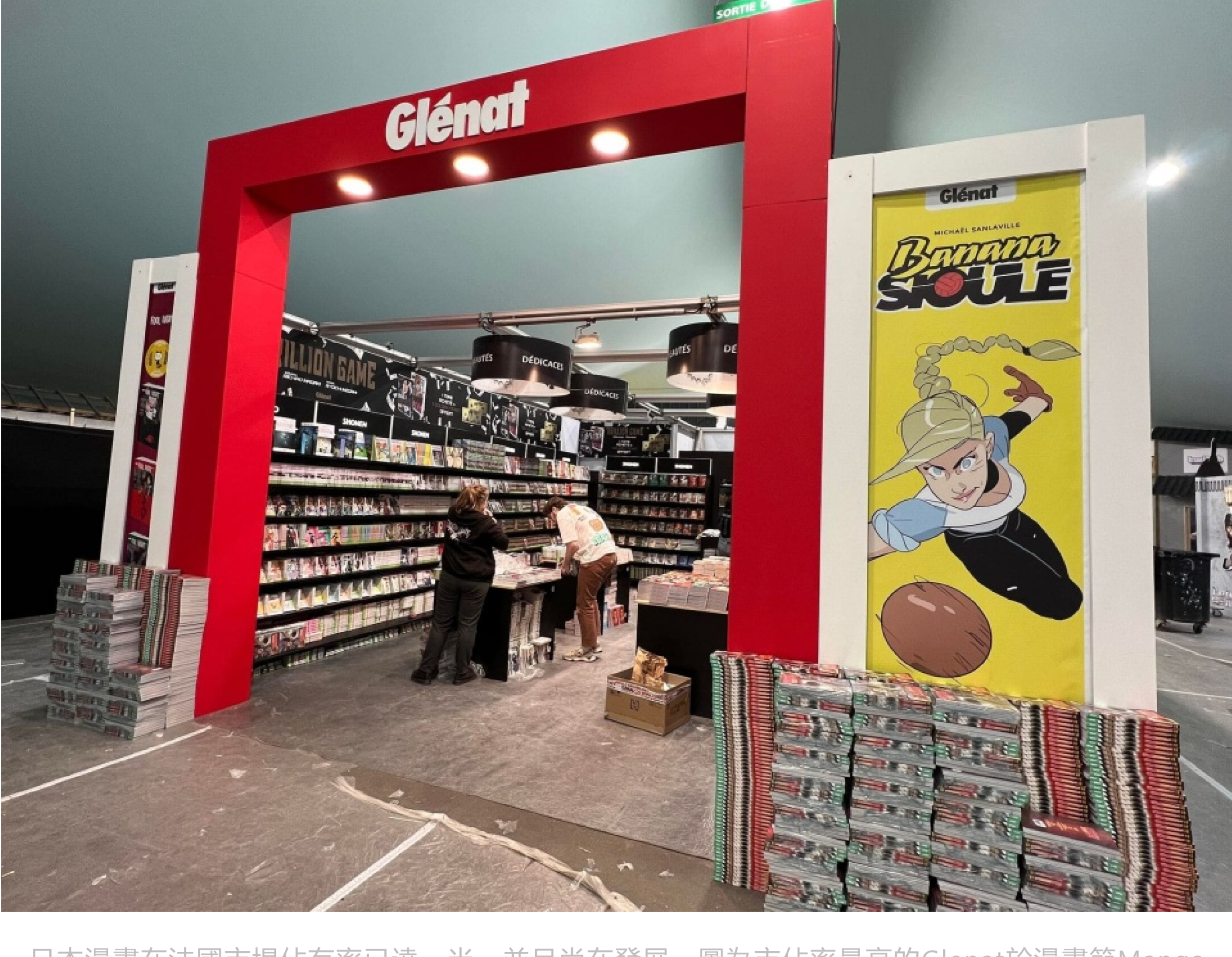
日本漫畫在法國市場佔有率已達一半，並且尚在發展。圖為市佔率最高的Glénat於漫畫節Manga City內的展位。

而幾家主流法國漫畫出版社亦不斷爭取不同的漫畫版權，以法國代理日本漫畫的三龍頭為例，在2019市場佔有率最高（23.9%）的Glénat出版社獲得《龍珠》、《One Piece》、《亞基拉》以及池上遼一老師作品的版權，排第二的Pika（13.4%）則出版《炎炎消防隊》、《Blue Lock》、《GTO》，排第三的Kana（12.5%）則是《Naruto》、《Hunter X Hunter》以及清澤直樹老師系列作品的代理（資料來源：Statista.com）。還有其他約佔10%的出版社正在互相競逐這個市場。此現象根本就是1990年代初香港各大出版社爭相購買日本漫畫代理權的情況，作為香港讀者，可以說頗有親切感。據統計，2022年日本漫畫在法國銷售量達4800萬冊，比2021年增長3.6%，以《One Piece》為首，排第二的是《Naruto》，第三則是《鬼滅之刃》。