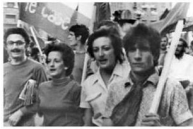
《12月12日》以左翼激進組織「Lotta Continua」為題材拍攝。(黑白圖片)