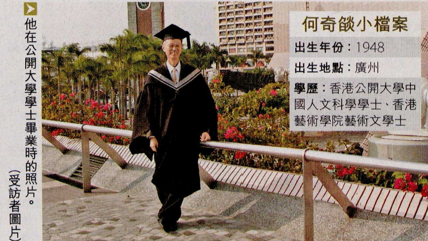
他在公開大學學士畢業時的照片。