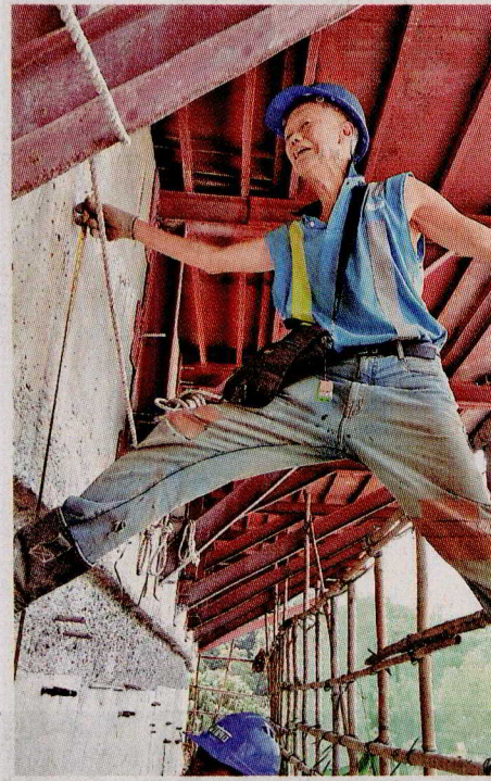
在地盤工作30多年，他認為當中的工作哲學也能應用在藝術創作。