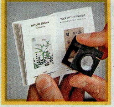
可用放大鏡觀看微型書入面的微型海報。