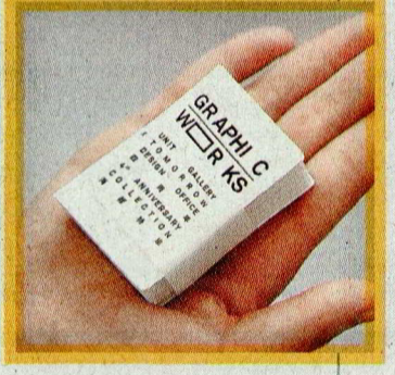
明日設計事務所選為是次展覽人手製作微型書，收錄逾 30 張縮小微型海報。

《設計平面：Unit Gallery x 明日設計事務所 四周年海報展》 9 月 2 日至 10 月 1 日 Unit Gallery (石硤尾白田街 30 號賽馬會創意藝術中心 5 樓 L5-23) 查詢：9453 1626 / unitgallery@yahoo.com.hk