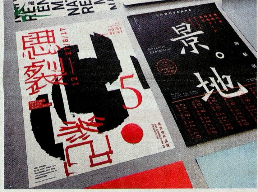
明日設計事務所設計的展覽海報，著重以視覺語言來傳遞展覽的主題。