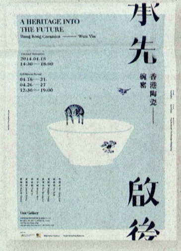
展覽《承先啟後》的海報曾在 Japan Typography Association 舉辦的 Applied Typography 中獲獎。

展覽展出印尼群島居民的豔麗服飾及日常服飾，印尼伊卡織品的用法等知識，多來自傳教士的記錄等，不少織造地區資料十分有限。研究者蒐集超過 50 個織區的製成品，配合研究著作《印尼群島的伊卡紡織》，呈現伊卡文化。 9 月 15 日至 11 月 26 日 · 香港大學美術博物館 網址：www.unaig.hku.hk