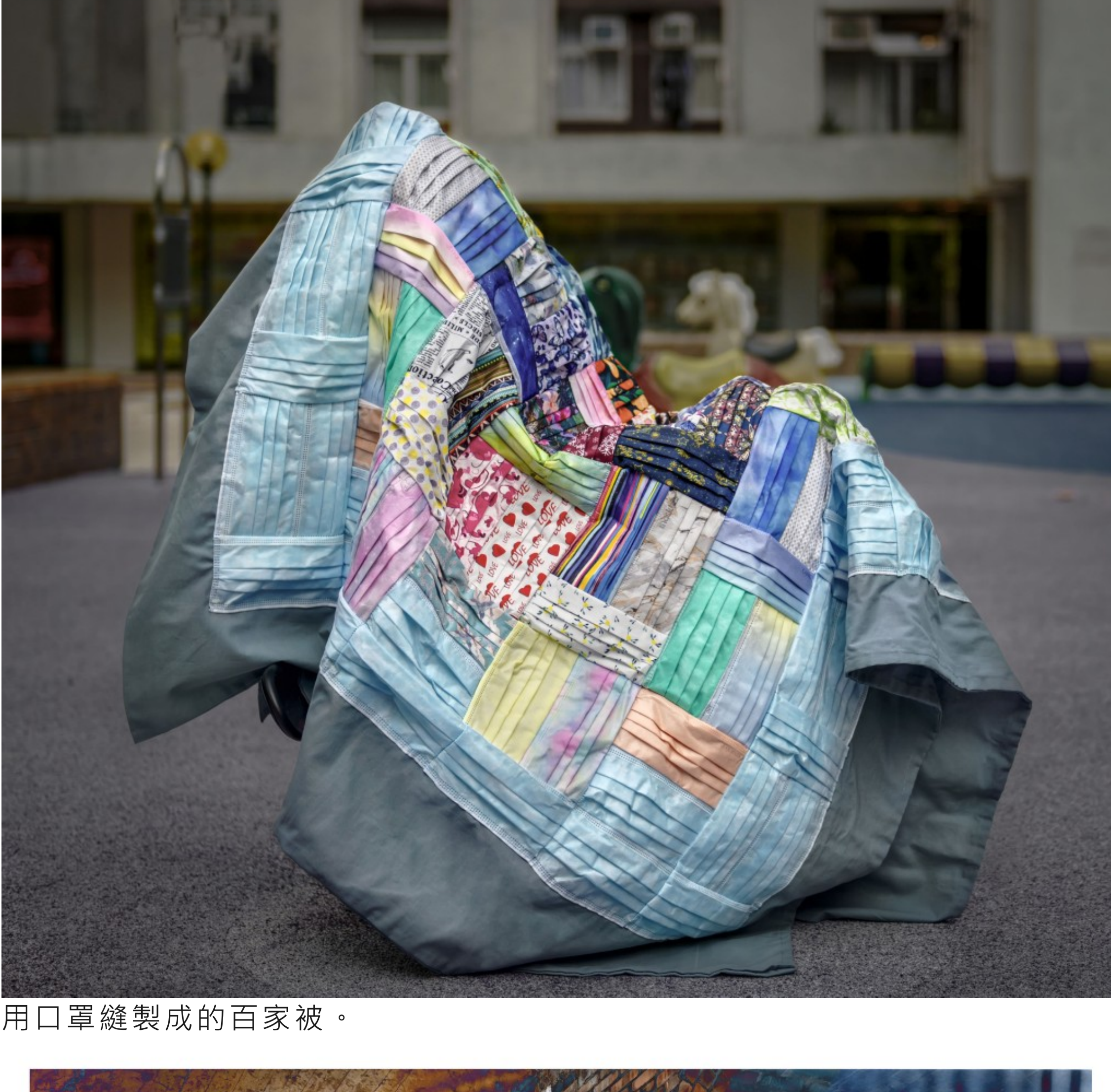
用口罩縫製成的百家被。