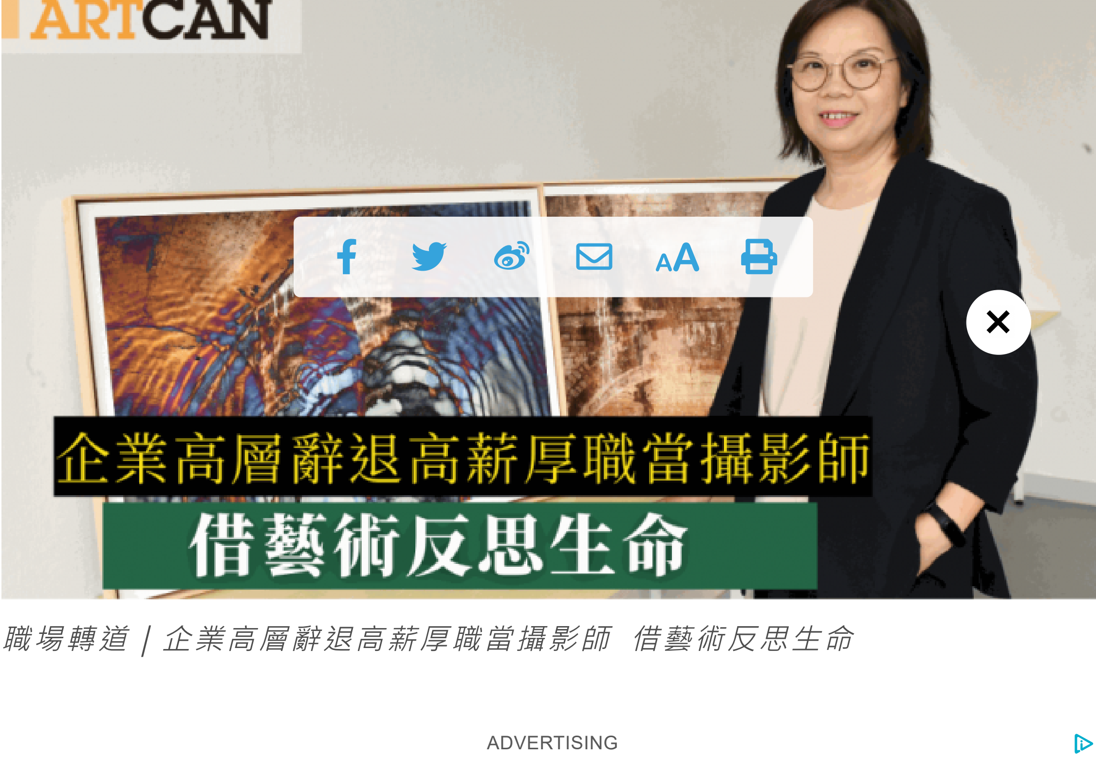
職場轉道 | 企業高層辭退高薪厚職當攝影師 借藝術反思生命