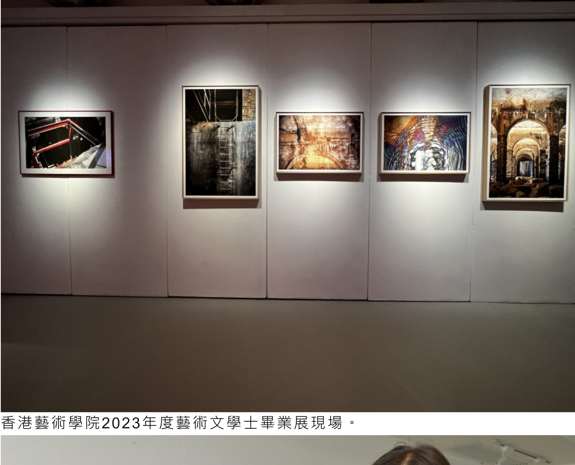
香港藝術學院2023年度藝術文學士畢業展現場。