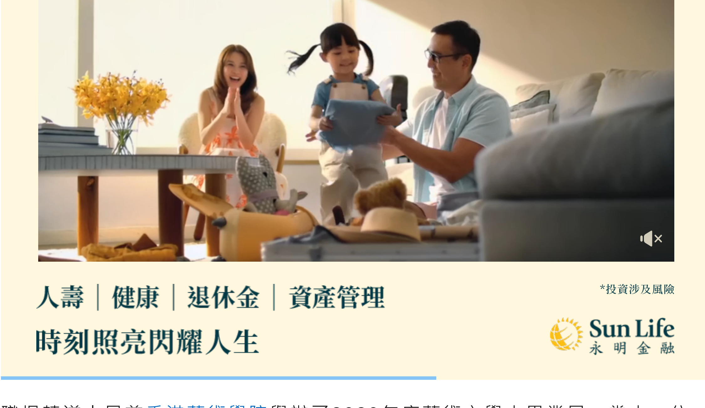
人壽 | 健康 | 退休金 | 資產管理 時刻照亮閃耀人生 Sun Life 永明金融