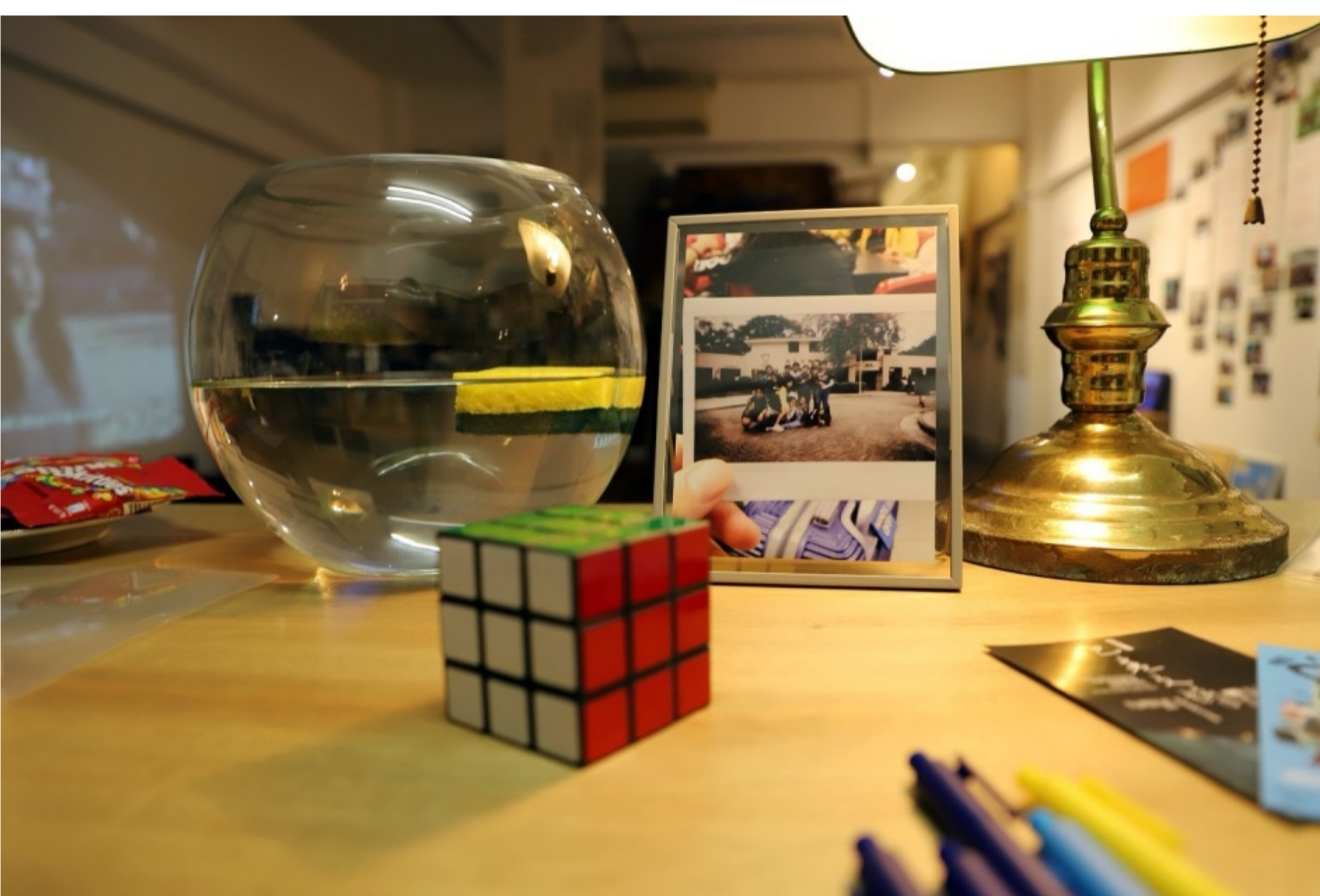
「在地漂流」展覽現場

翻開一本厚重的相簿，從影像出發，每頁連結他人的記憶、歷史和情感，與不同年歲的自己相遇。在是次展覽上，觀眾可回顧歷屆計劃的學員短片作品，聽學員、導師及工作人員以聲畫、文字、物件等不同媒介，分享參與點滴，以及在地生活與身份認同的所思所想。