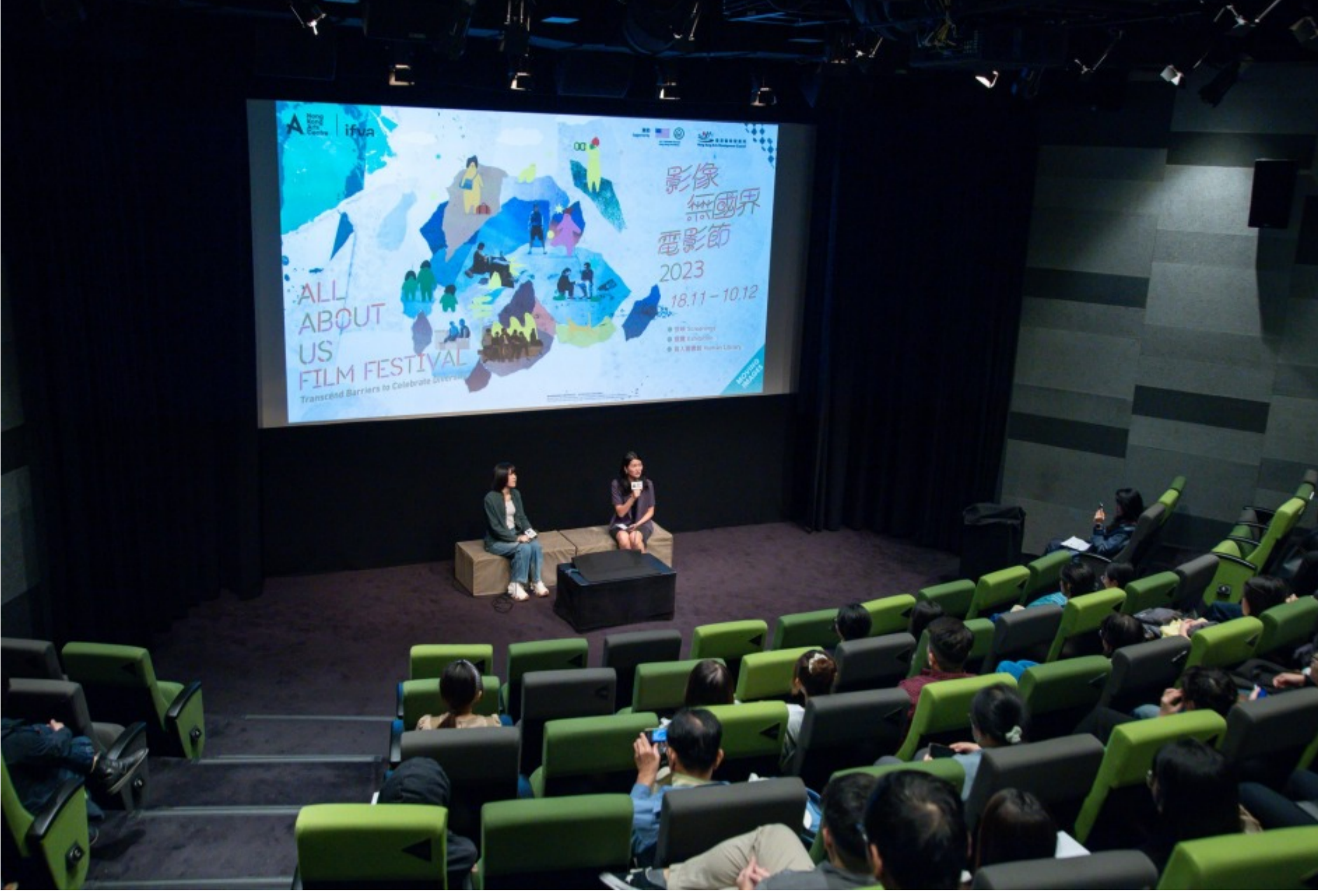
2023年「影像無國界」電影節

【禮訊】由香港藝術中心主辦，ifva於2009年起開辦「影像無國界創意影像計劃」，為在港少數族裔青年免費提供影像教育。通過影像製作訓練營及連串實戰經驗，該計劃的學員可學習劇本創作、攝影、道具等一系列影像知識，並創作屬於自己的光影故事。計劃成立至今，出產無數由少數族裔攝製的短片，學員人數超過600人。2013年，「影像無國界」獲香港藝術發展獎的藝術教育獎。