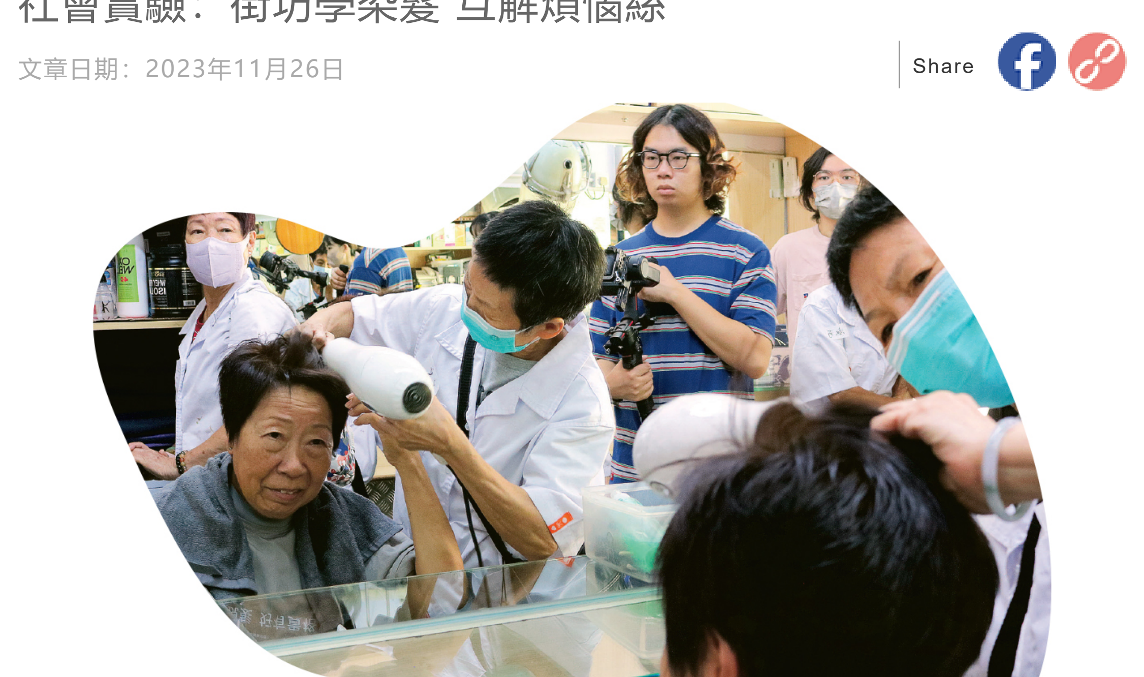
麗華坊街坊幫她染髮色感滿意，她直言做染髮model需而莫大勇氣。