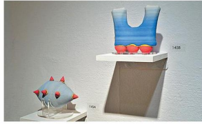
▲莫麗晴以3D打印技術將原本給人傳統感覺的陶瓷，轉化成新形態，作品名為《Starry》，由「與藝術有約」——The Collectible Art Fair J展覽，展出新畫作。

陶瓷結合，以3D打印技術做出各種形態，讓原本給人傳統感覺的陶瓷，以鮮艷顏色並帶幾分玩味的形象出現。