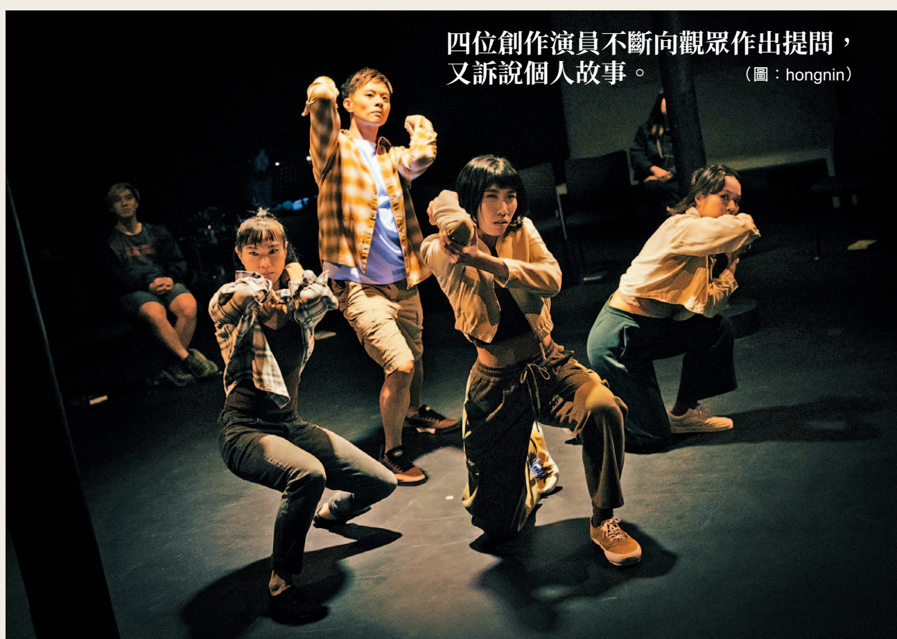
四位創作演員不斷向觀眾作出提問，又訴說個人故事。