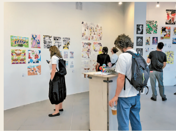
今年9月舉行的捷克「LUSTR」漫畫插畫藝術節現場。