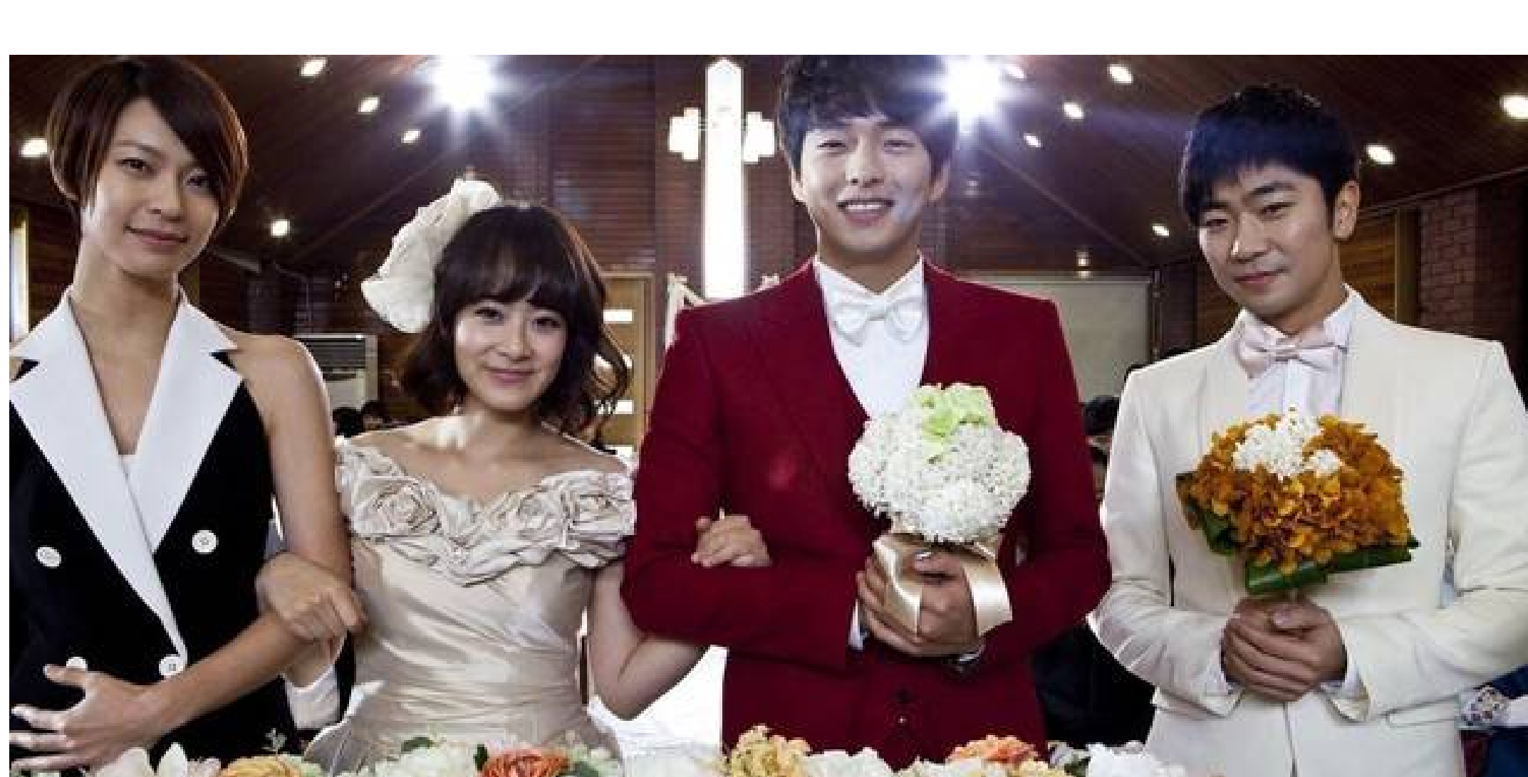
《兩個婚禮一個葬禮》劇照

除了新晉導演作品，今次影展其中一套話題之作，是金趙光秀的作品《兩個婚禮一個葬禮》。金趙光秀是韓國少數公開性取向的同志導演，為了推動社會改變，他不但創作多套同志題材電影，更在2013年公開舉辦韓國首場同性婚禮，與同為電影人的伴侶金勝換成婚。縱使不為法律所容，更面對大量仇恨言論與威脅，但他仍帶頭發起訴訟，要求政府承認同志婚姻。《兩個婚禮一個葬禮》是他的首部長片作品，內容講述仍屬好友的男同志民秀和女同志孝珍，為了與各自的伴侶一起享受生活，決定辦理假結婚，把住所搬到相連地方，從而與他們的愛人同住。然而，民秀的父母卻突然來訪，引發出一串連鎖反應。這部愛情喜劇看似輕鬆浪漫，卻反映荒誕的殘酷現實。香港近日才確認同性伴侶擁有申請公屋及入住居屋權利，然而其中一宗案件申請人已因抑鬱困擾自殺離世。二人相愛卻不能相依，並非只是電影橋段，亦是我們身處的社會現況。但願這種荒謬情節終會落幕，將禁色盡染在夢魂外。