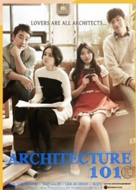
《初戀築跡101》 29/10 (Sun) 19:30