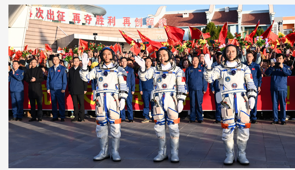
回放 | 神舟十七號載人飛船出征