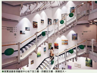
展覽活動區香港藝術中心地下至三樓，約樓上畫廊，規模宏大。

另一校友、當代藝術家張德烈的作品獲本地及海外博物館及美術館展出，包括2019年美國福阿爾一千博物館。他顯較在香港