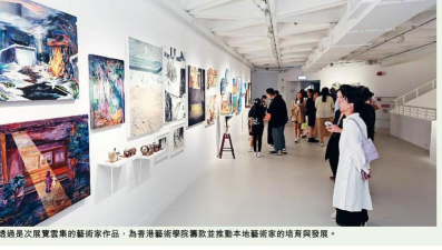
主辦方期望透過是次展覽聚集的藝術家作品，為香港藝術學院推動本地藝術家的培育與發展。