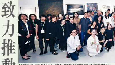
首屆The Collectible Art Fair日前正式開幕，匯集逾200名本地藝術家，展出逾300件作品。

疫後實體藝術展覽逐一回歸，卻鮮有專注聚焦本地藝術家的大型聯展。今日至11月16日假香港藝術中心包氏畫廊及貴馬會展廳舉行的第一屆「The Collectible Art Fair」，由香港藝術中心及香港藝術學院合辦，並由香港藝術學院校友會負責籌劃，展出逾200名本地藝術家共300多件作品，期望以培育新一代藝術家為起點，提高大眾對本地藝術家的關注。