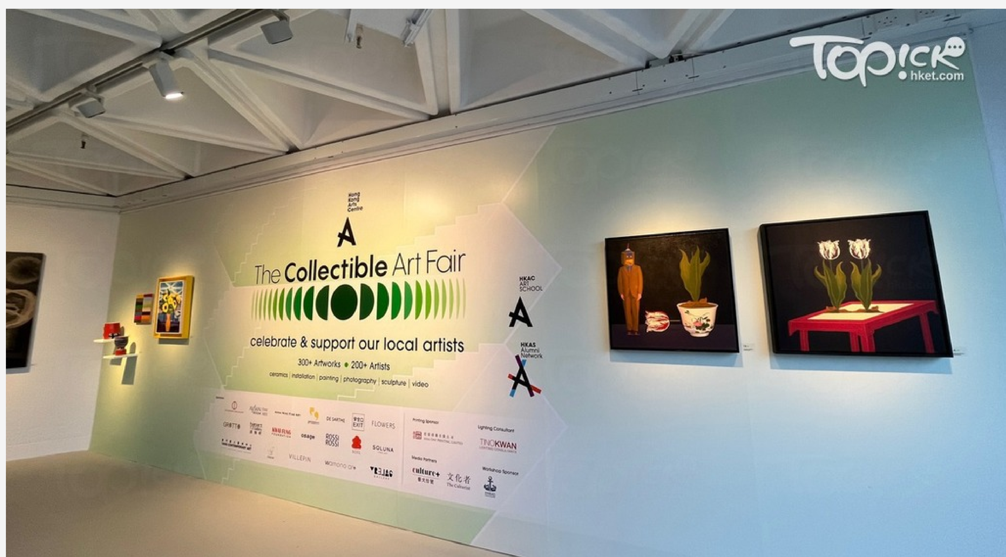
▲ 首屆「The Collectible Art Fair」本周日起舉行。

熱門 中一面試 名校專區 羅密歐與祝英台 區區有好校 香港人在北京 新手爸媽 COLLAR 白日之下 東張西望