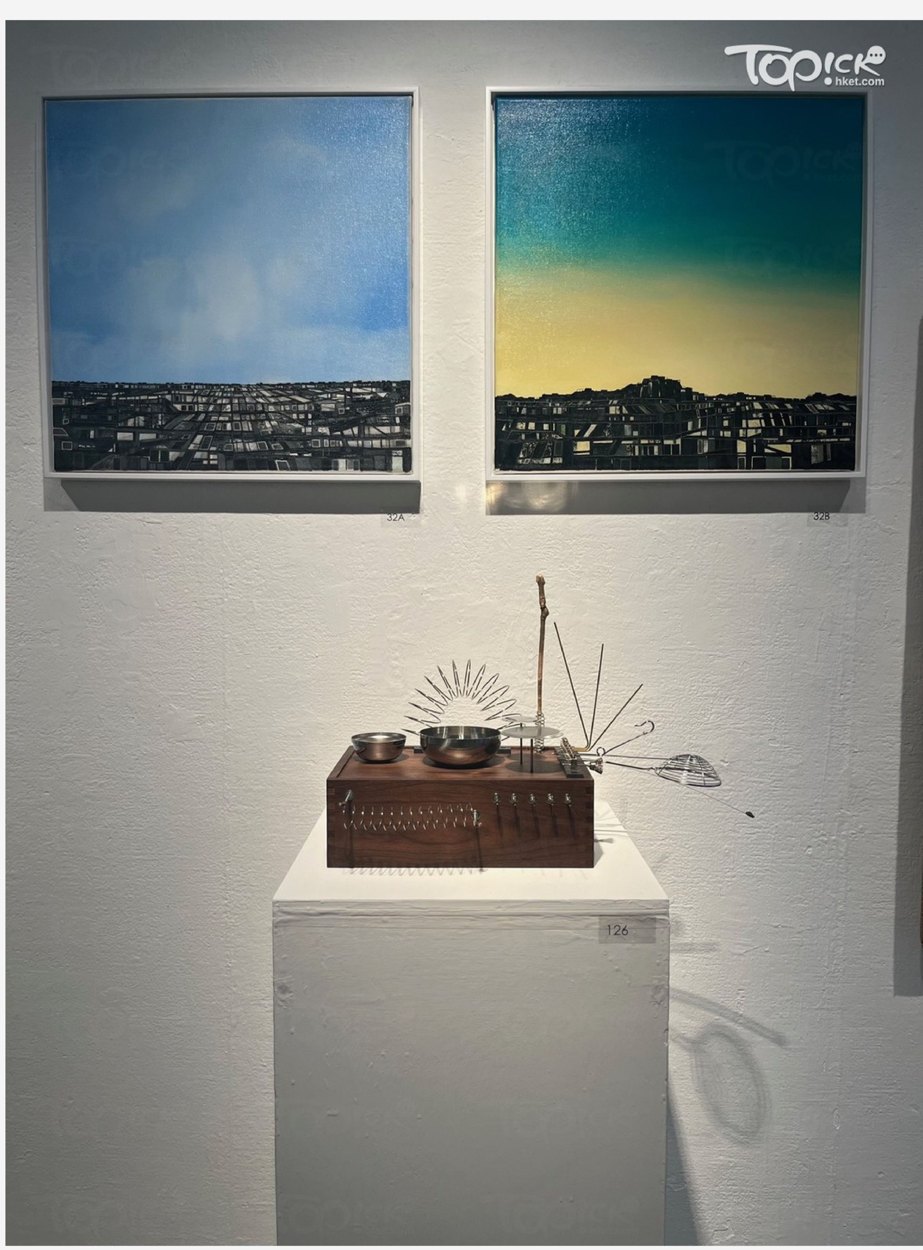
▲ 展覽收益扣除必要開支後，將全額撥捐香港藝術學院發展及培育年青藝術家。

「The Collectible Art Fair」將展出超過200位香港藝術院校友及藝術家逾300件風格多樣的藝術作品，涵蓋繪畫、雕塑、陶瓷、裝置藝術、攝影及錄像等多元化媒介，讓大眾一覽風格多樣並獨特的藝術創作。