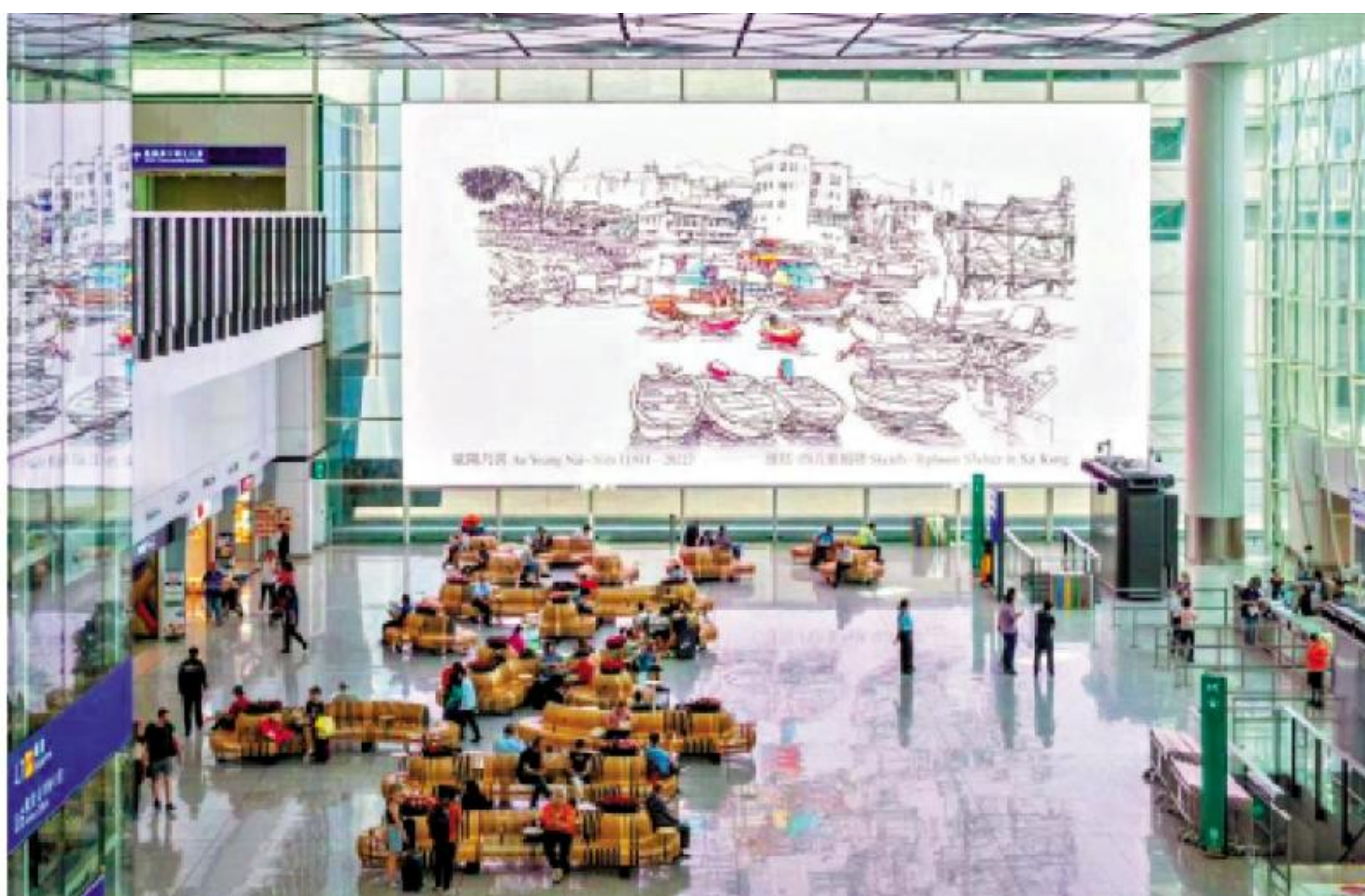
圖：巨型數碼幕牆呈獻「躍動藝術之旅」。

【大公報訊】疫情三年以後，香港國際機場再辦文化藝術節，由即日起至12月31日於機場多個地點舉行精心策劃的展覽及表演，以各種形式的藝術創作，展示香港深厚的文化底蘊，讓旅客在抵港及離港之際都可以沉浸於香港充滿活力的文化及藝術氛圍之中。