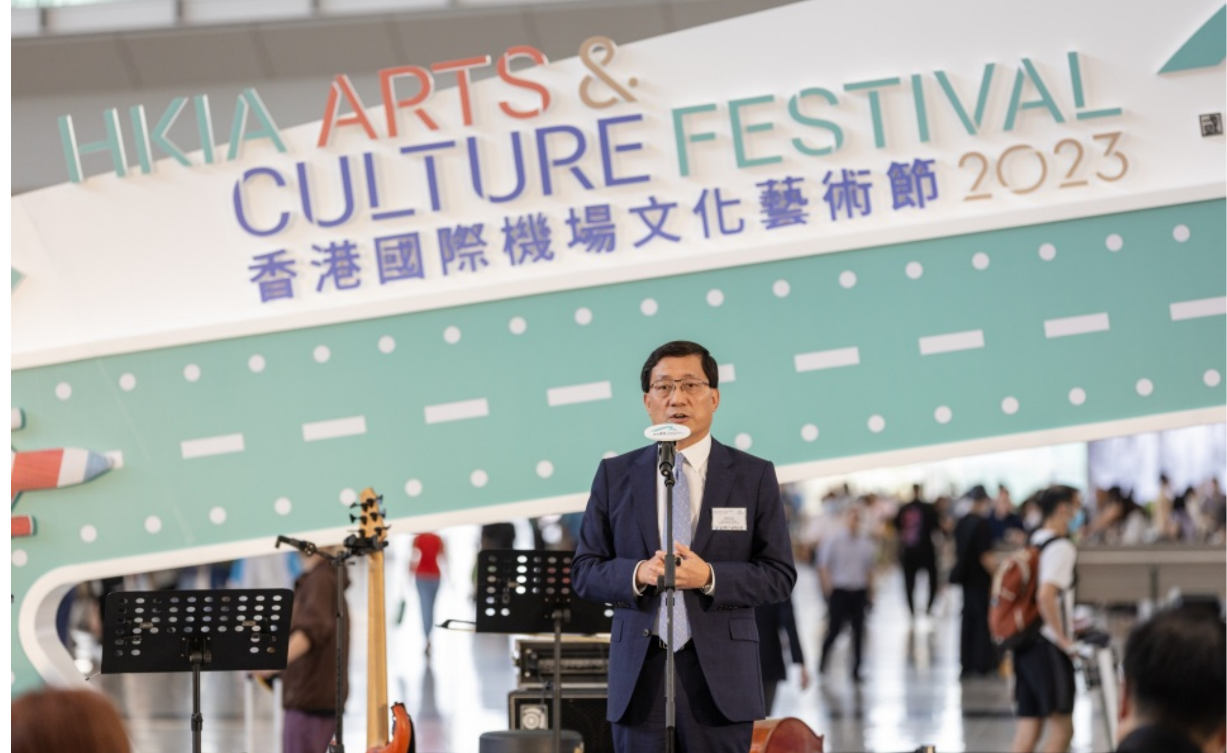
機管局行政總裁林天福致辭

本次文化藝術節為機管局攜手多個本地藝術文化單位合作，共同呈獻多個匯聚著名及新晉本地藝術家的展覽及表演，為旅客締造獨一無二的回憶。機管局行政總裁林天福於開幕式致辭時表示：「經過三年疫情後，我很高興這項盛事終於重臨香港國際機場。作為旅客到港第一道門戶，機場是一個理想平台，向旅客展現本港多元文化面貌，並讓旅客有更愉快的機場體驗。」