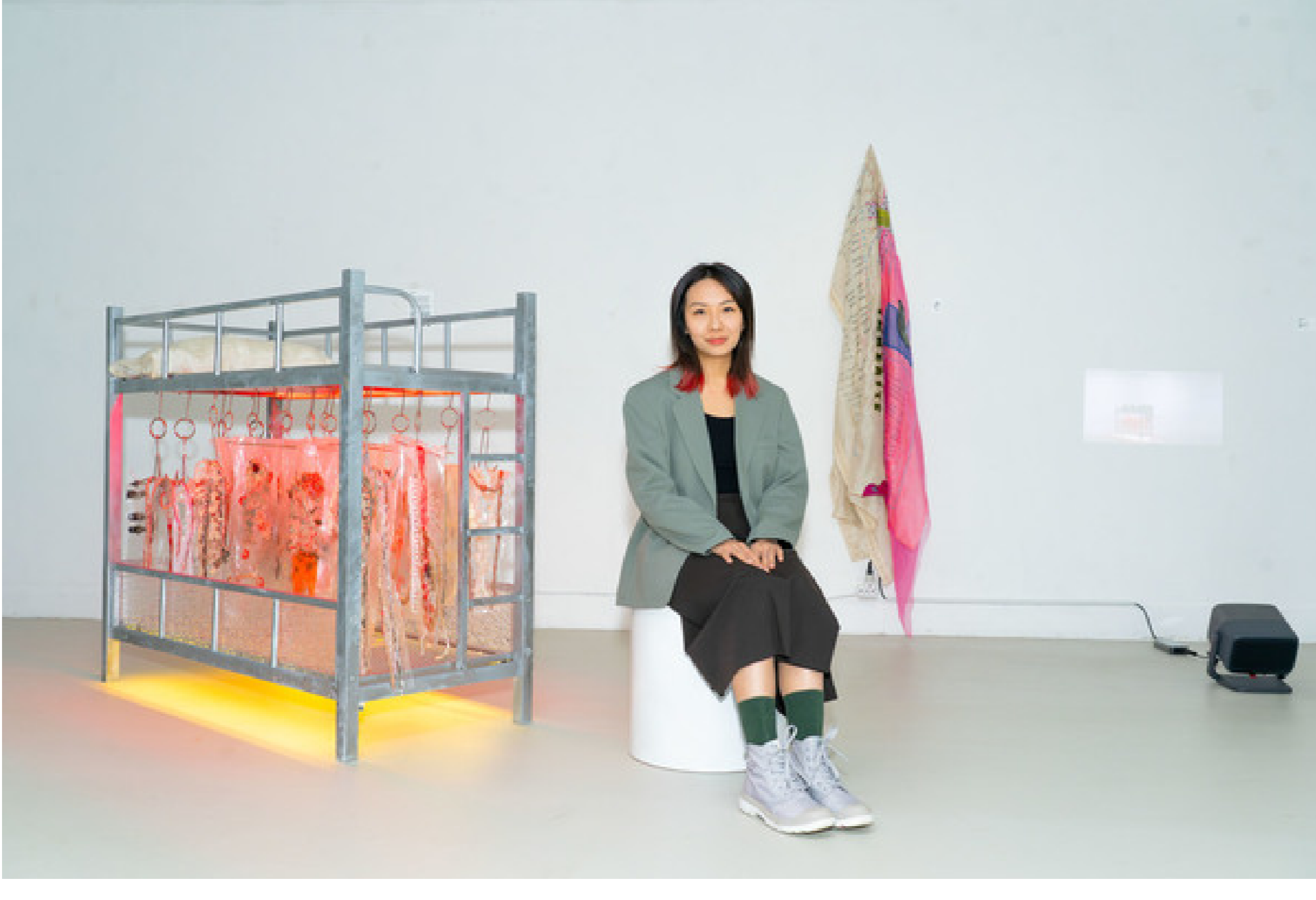
畢業展「遊園終日」展出Doris的裝置藝術作品《Dear Nietzsche》。

她認為，藝術創作就是不斷探索自我的過程，令她誠實面對內心隱晦的一面，再將想法抒發在作品上，例如畢業展「遊園終日」上的裝置藝術作品《Dear Nietzsche》，就以床架、香口膠等材料塑造成街市肉檔，再輔以行為藝術，反思女性社會上的角色和價值。她指藝術使人忠於自己，作品往往反映創作者最真實的一面，「好多人看到我的作品都覺得『好核突』，但這就是真實。」