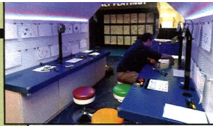
彈珠機以外，更有小型遊戲中心，給大家試玩另外三款由 PAPERTRONICS 系統所發展的電子小遊戲。