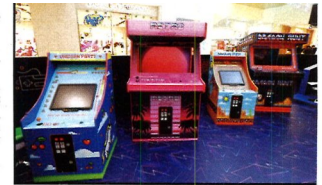
現場更有多部富 80 年代特色的仿製街機，打卡一流。