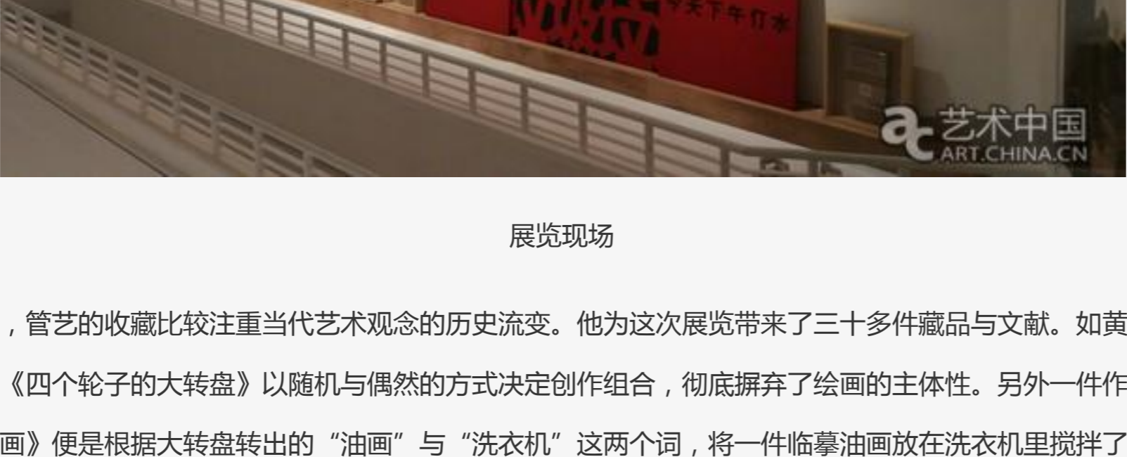
郑好收藏的约瑟夫·博伊斯作品在展览现场

郑好这次展览的藏品有11件，主要是约瑟夫·博伊斯和马克思·吕佩尔茨的作品。博伊斯那张闻名遐迩的照片《革命就是我们》展现了博伊斯本人大步向观众走来的姿态，上面有“革命就是我们”几个手写字和印章。另外一件作品《大白兔奶糖》也是他的代表作。这次精选的五件博伊斯作品是首次在香港展出。而德国新表现主义的吕佩尔茨的六件青铜彩绘《男演员》、《玩具动作》、《女婢》等都是吕佩尔茨创作于1990年代表的精品。这些藏品反映了一个70后大陆收藏家的国际视野与实力。