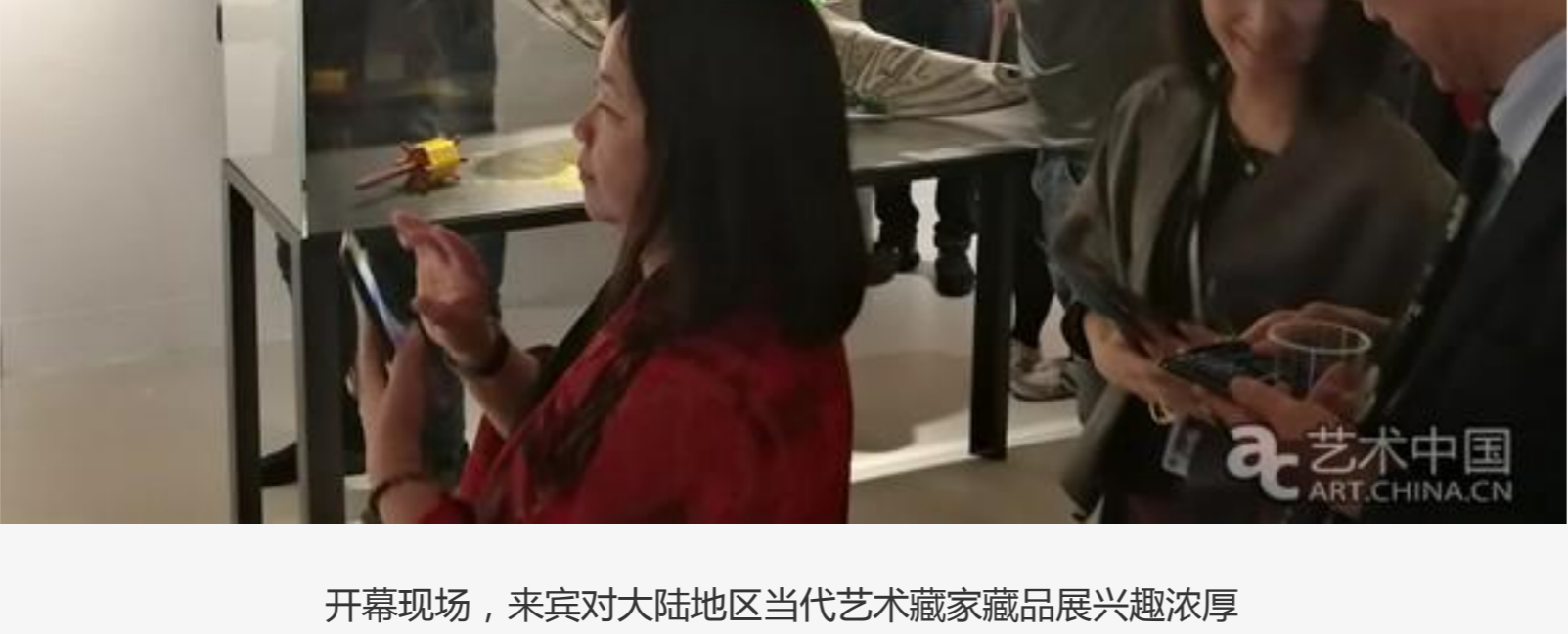
开幕现场，来宾对大陆地区当代艺术藏品展兴趣浓厚

香港艺术中心第五届《收藏家当代艺术藏品展》3月26日晚在香港揭幕。这是该中心首次为中国大陆地区当代艺术收藏40年所做的专场展览。本次展览由凌敬担任策展人，五位来自内地及海外的收藏家向本次展览提供了70多件藏品与文献，26位中国艺术家、8位外国艺术家的作品陈列在香港艺术中心包氏画廊与公众见面。数百位来自香港、内地，以及亚洲、欧美的嘉宾参加了本次开幕典礼。