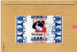
在第五屆《收藏家當代藝術藏晶展》展出的 Joseph Beuys《White Rabbit》(大白兔)，是否勾起童年回憶？