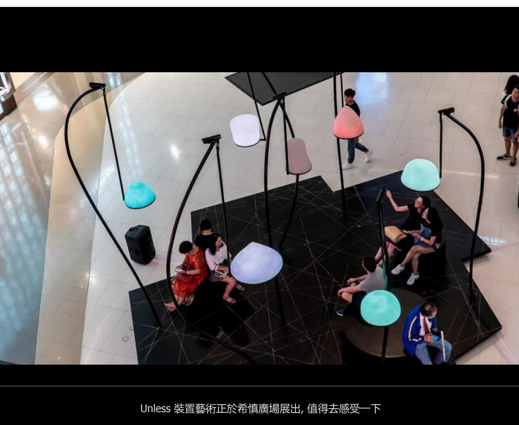
Unless 裝置藝術正於希慎廣場展出, 值得去感受一下