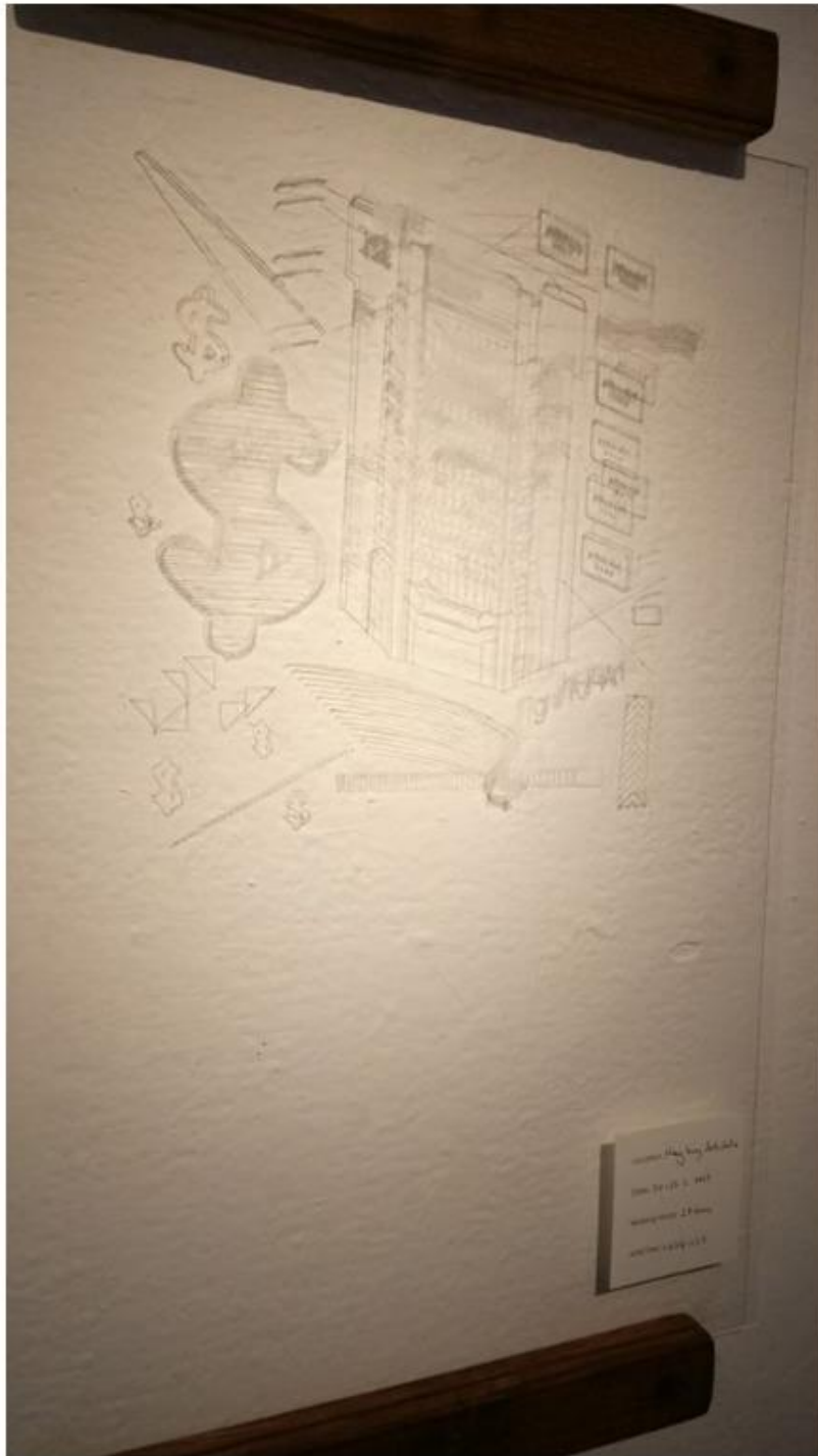
「流動藝術自動售賣機」繪成的作品