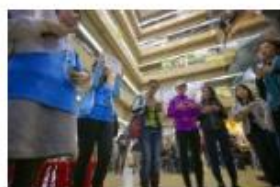
每位參加者戴着耳機，聽着廣播劇遊走在大街小巷。