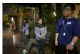
阿翳笑言最初怕參加者邊聽邊走，太多事情要兼顧，後來發覺香港人習慣邊走邊接手機，完全難不到他們。