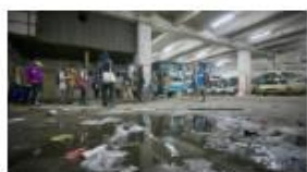
導賞團帶參加者走進平時未必留意到的地方，例如此處帶點陰森的巴士廠。

緊貼果籽報道，即like： http://fb.me/AS_AppleDaily 📷 🍎