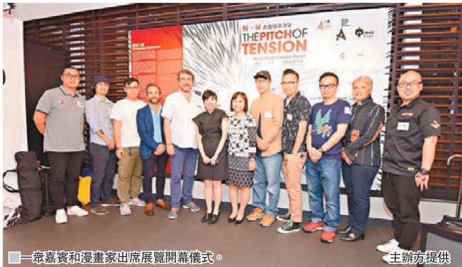
■ 眾嘉賓和漫畫家出席展覽開幕儀式。

力，是構成物理世界重要的一環，同時充滿美感，在每個動作開始的瞬間，能量由零慢慢達至頂峰，形成一個又一個富有節奏的波浪，又或是一條條美麗的拋物線。力的表現方法千百種，又豈止武打一門一枝獨秀？除了肌肉賁張的角色們拳拳到肉的「爆發力」外，還有風馳電掣的「速度感」，身體擺動的「節奏感」，盛大場面的「震撼力」，正邪交鋒的「熱力」和「磨擦力」，劇本裡交織的「張力」……這些「力」的元素都可以從展覽