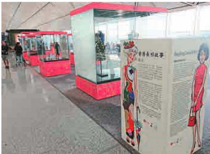
▲「香港長衫故事」系列展