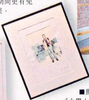
■馬榮成 《小男人周記》