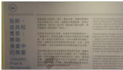
▲ 展版會寫出漫畫的成稿步驟，有助大家了解每幅畫都得來不易呀