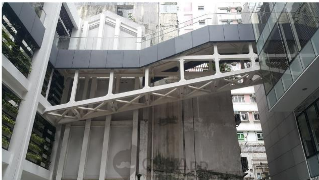
▲連接四樓與三樓露台的行人橋，甚具標誌性