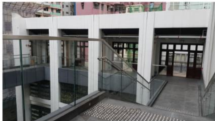
▲於重建時特定保留了綠屋的廣東建築特色