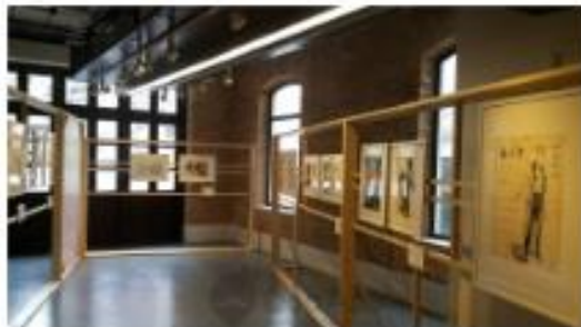
▲每個漫畫家最少有兩幅畫作