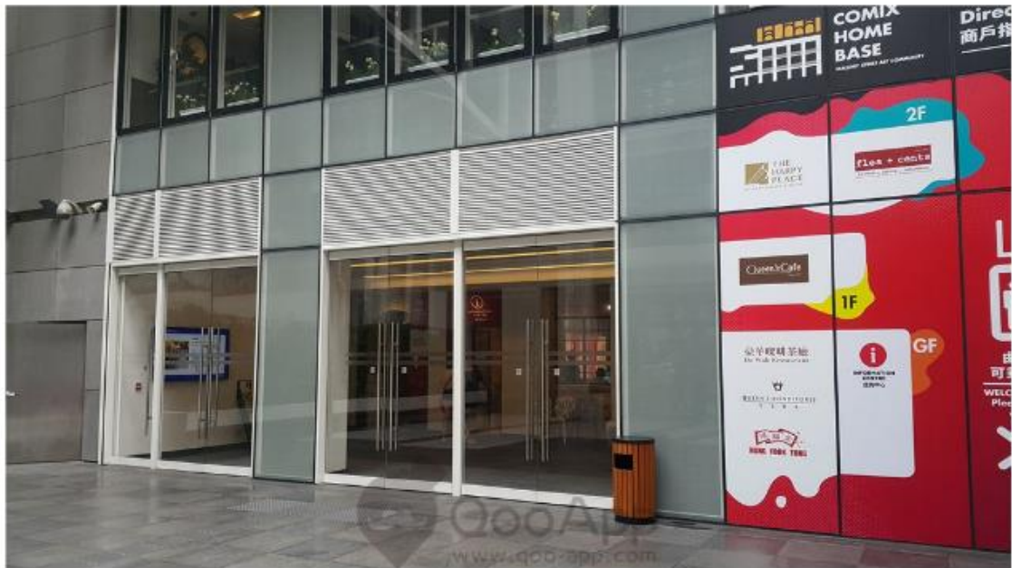
▲基內有食肆、咖啡廳及精品店

讀者可以乘坐地鐵到灣仔站A3出口，再往銅鑼灣方向步行10 – 15分鐘來到，或者轉乘電車於巴路士街的站下車（於軒尼詩道官立小學對出）。基地中庭是個廣場，視野甚好，跟周遭煩囂的街道有很強烈的對比。一樓是食肆，也有些精品可以購買，二至四樓則是主要的展覽區，活動一般在二及三樓舉行。