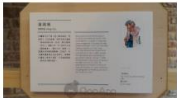
▲畫作下有一塊小木牌列出作家簡介