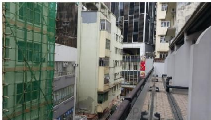
▲看上去真的是橫街窄巷