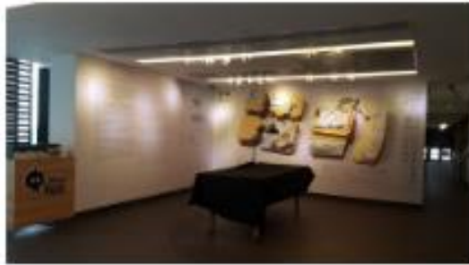
▲甫到三樓，映入眼簾會有一壁簡介