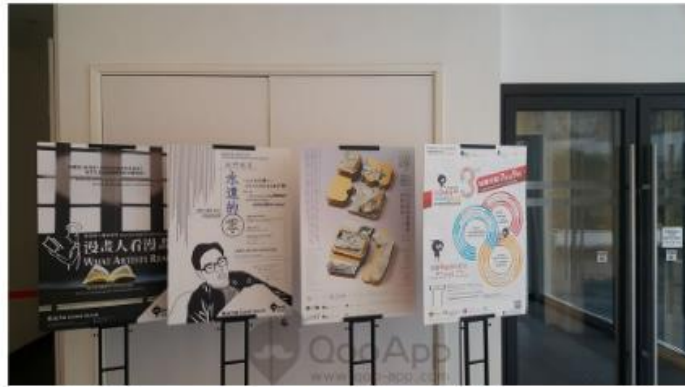
▲門口有展覽板可以看到現在及未來的活動