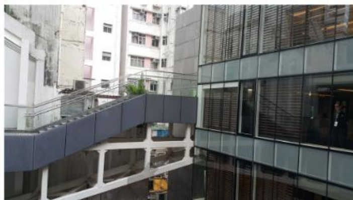
▲由另一個角度看剛剛那道橋